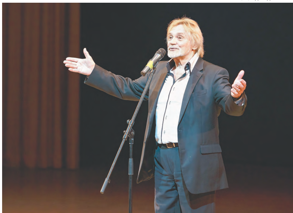
Народный артист России и СССР Владимир Васильев на «Арабеске-2016»

С 2012 года внутри «Арабеска» существует конкурс современной хореогра-