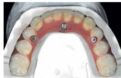
Постоянный несъёмный протез по технологии Trefoil («Все на трёх»)