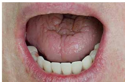
Новый протез, установленный в день операции. Авторство — врач стоматолог-хирург Никонов Дмитрий Александрович