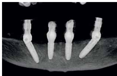
Рентгенологический снимок сразу после установки имплантов

Пермь, ул. Пермская, 161 тел.: +7 (342) 258-34-34, 258-39-39 астрamedцентр.рф