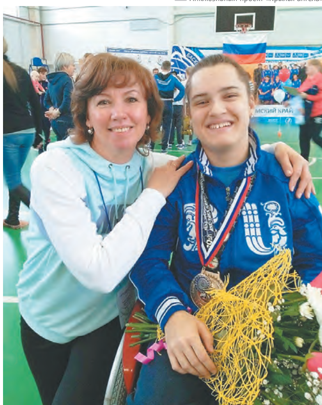
Инклюзивный проект «Крылья ангела»