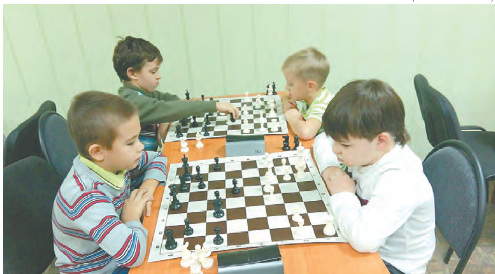
Пермский шахматный клуб