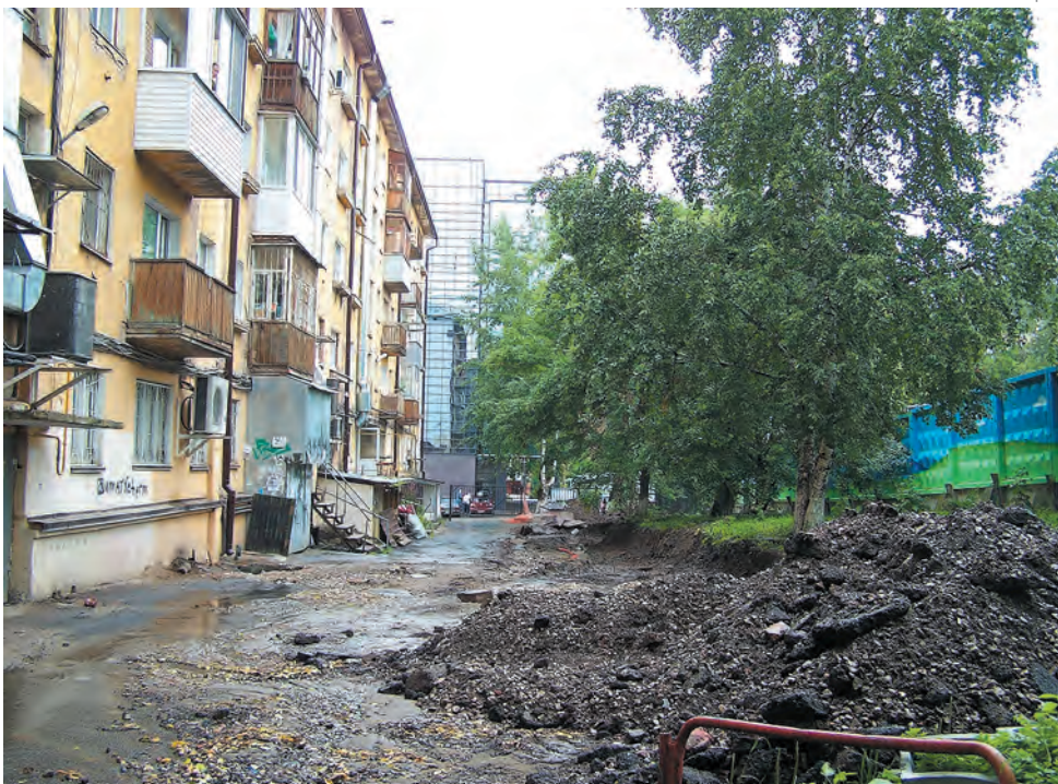
Началось благоустройство дворовой территории на Комсомольском проспекте, 30 и 32