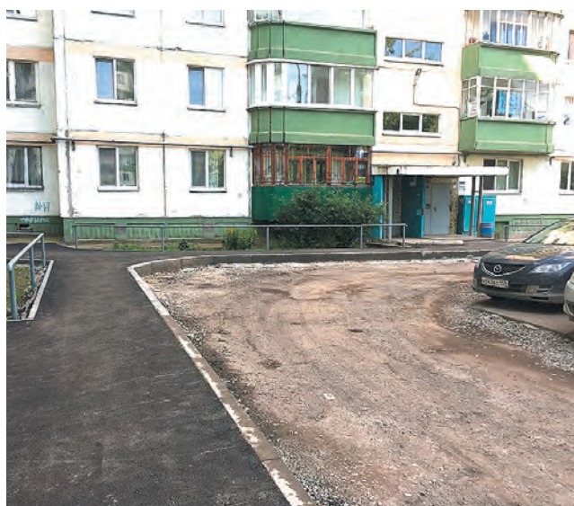
Ремонтные работы во дворе на проспекте Декабристов, 33 в рамках проекта «Городская среда»

На сегодняшний день самым популярным допол-