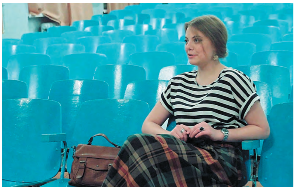
Кадр из фильма «Дневник училки», режиссёр Дарья Абатурова