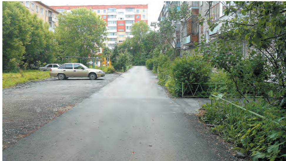
...и после проведения благоустроительных работ