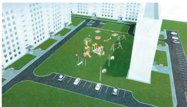
Двор на ул. Ушакова, 59/1

Первые дизайн-проекты дворовых территорий уже готовы и прошли общественное обсуждение. Так, например, жители дома на ул. Елькина, 7 планируют обновить тротуар, проезд, обустроить для занятий спортом хоккейную коробку с баскетболь-