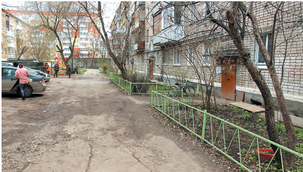
Двор дома №32 на ул. Народовольческой до ремонта...