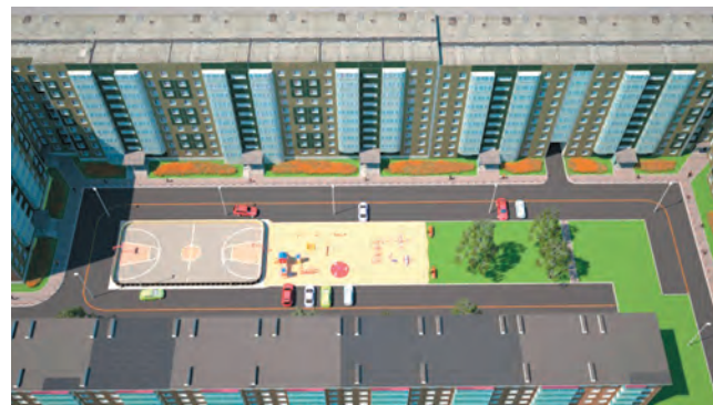
Двор на ул. Елькина, 7

ковки, установить спортивную площадку с баскетбольными кольцами, а также дополнить новыми элементами уже существующую детскую площадку.