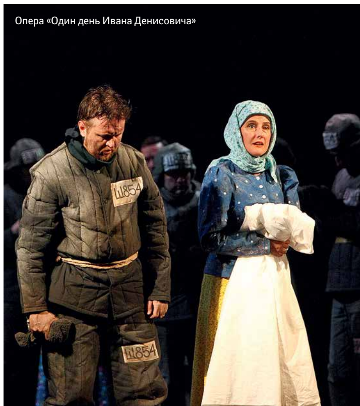
Опера «Один день Ивана Денисовича»

На закрытии был представлен балет в одном действии «Видение Розы» в исполнении солистов Пермского театра оперы и балета. В заключительной программе выступали солисты Парижской оперы Клэрмари Оста и Николя Ле Риш с отрывком из «Лебединого озера», звёзды Баварского государственного балета Северин Ферролье и Лукаш Славицки с отрывком из «Дамы с камелиями» и артисты Мариинского театра с балетом Уильяма Форсайта «Там, где висят золотые вишни».