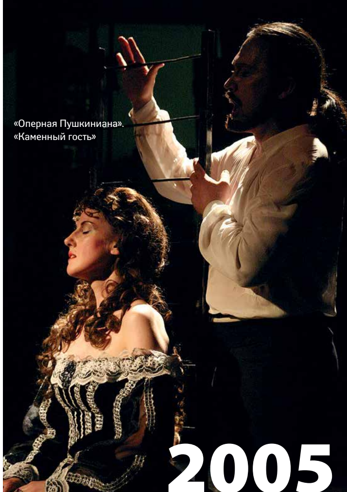
«Оперная Пушкиниана». «Каменный гость»

На церемонии открытия была показана гала-программа «В честь Дягилева». На большом экране демонстрировалась видеозапись одноактного балета «Послеполуденный отдых фавна» Парижской национальной оперы, а оркестр Пермского театра оперы и балета в это время исполнял музыку Клода Дебюсси. Мариинский театр представил фрагменты из классических балетов, пермская балетная труппа исполнила «Серенаду» на музыку Петра Чайковского.