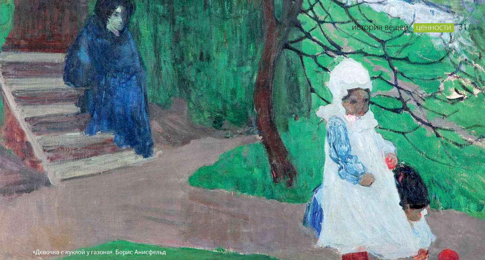
«Девочка с куклой у газона». Борис Анисфельд