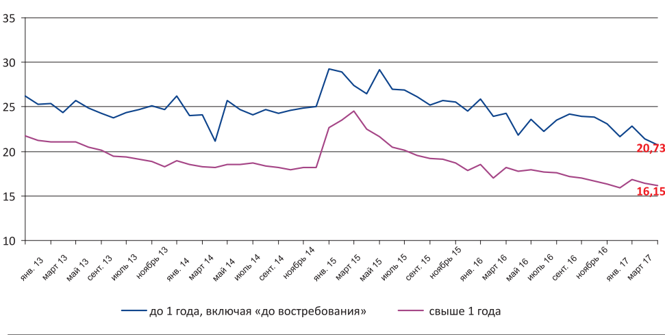
Средневзвешенные ставки по кредитам для физлиц (без учёта Сбербанка), % годовых