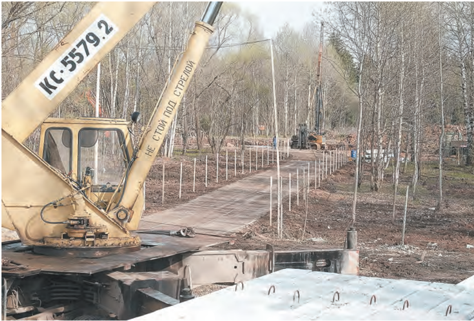
Первые сваи для новых вольеров