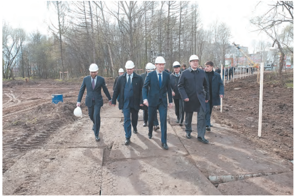
Главы Прикамья и Перми проверили ход строительства нового зоопарка