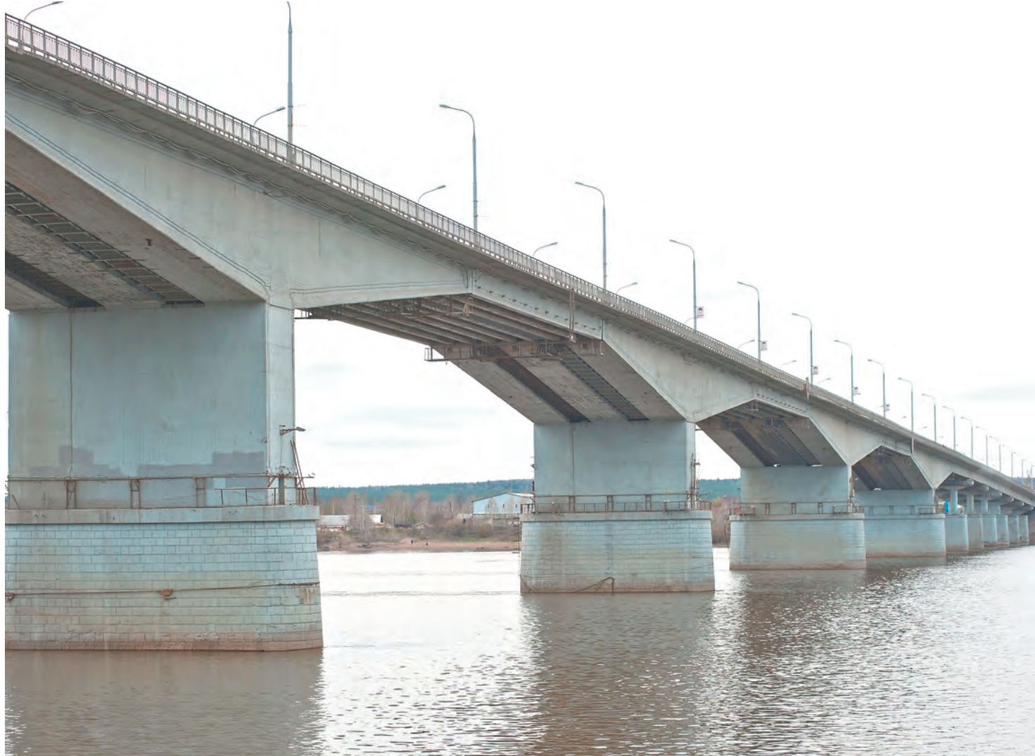
Даже если Коммунальный мост прослужит ещё несколько лет, он уже сегодня не справляется с транспортной нагрузкой