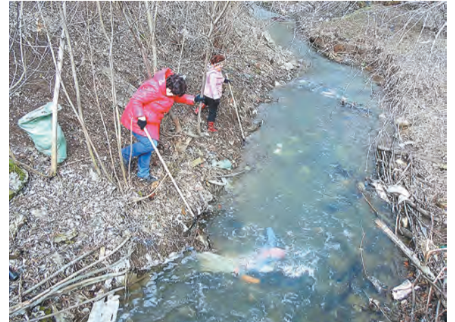
...и горы мусора в наши дни

цына. В последние годы постройка успешно превратилась в стихийную свалку.