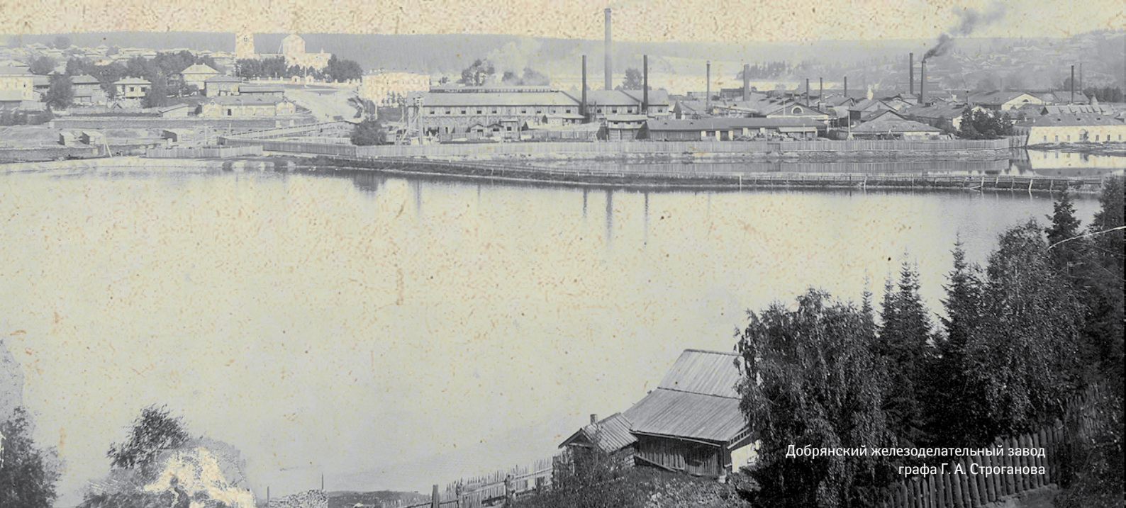
Добрянский железодельный завод графа Г. А. Строганова

По воспоминаниям губернатора Пермской губернии с 1911 по 1914 год Ивана Кошко (1859–1927), князь Абамелек-Лазарев «был богатейшим человеком на Урале. <...> Его особняк на ул. Миллионной (в Санкт-Петербурге — ред.) был далеко не мал. <...> Особняк этот был дивно обставлен. Каждая вещь, каждый ковёр стоили целое состояние». К слову, князю принадлежали три рядом стоящих особняка на ул. Миллионной. Однако большую часть