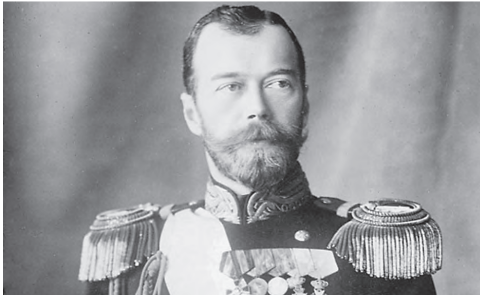
Кадр из фильма «Тайны века. Николай II. Отречение»

«100 лет — магическая цифра, нули которой, как окуляры, приближают к нам то время. Важная особенность задуманного кино клуба в том, что мы не будем навязывать никаких идеологий. Мы намерены исследовать 1917 год с точки зрения самих себя. Тогда, в 1917-м, это была наша страна, и сейчас это тоже наша страна. Так что изменилось? Я считаю, что 100 лет назад произошла трагедия, которая до сих пор живёт в коллективном бессознательном в виде