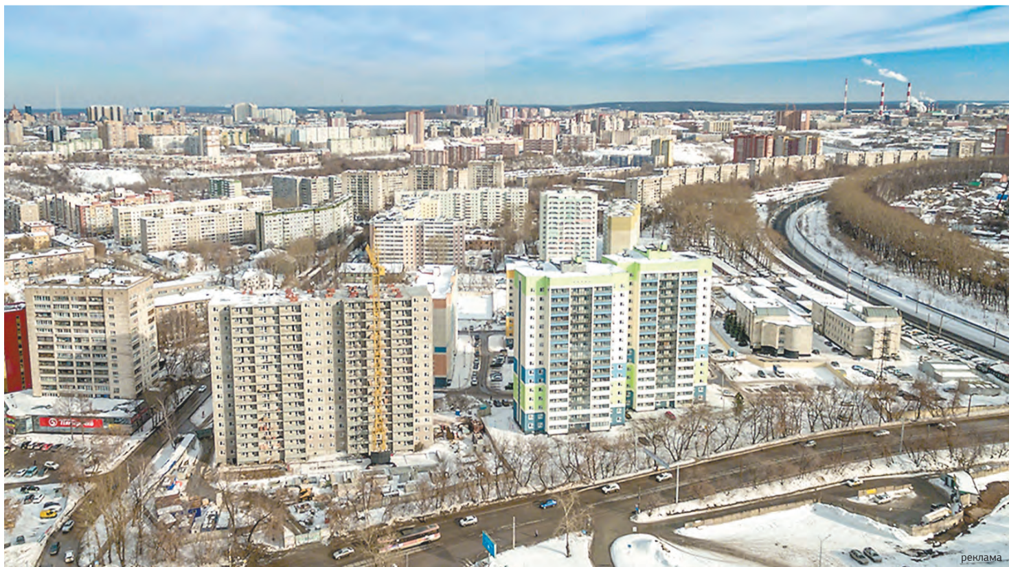
Вид на квартал №589 — первый в Перми проект реновации застроенных территорий

— Основные строящиеся объекты находятся на территории Кировского района Перми, микрорайонов Заостровка, Вышка-2, Гайва. Жилые комплексы