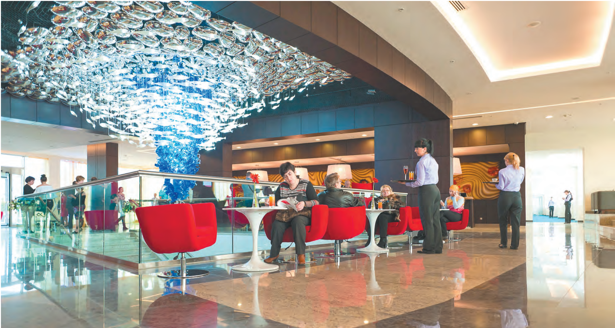
Среди лидеров привлечённых инвестиций — гостиничный и ресторанный бизнес (рост в 2,9 раза), производство и распределение электроэнергии, газа и воды (+88%), строительство (+56%), торговля (+35%)