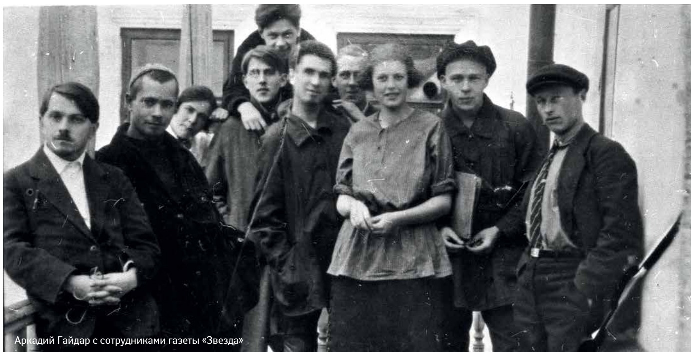
Аркадий Гайдар с сотрудниками газеты «Звезда»