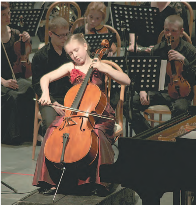
Пермская краевая филармония