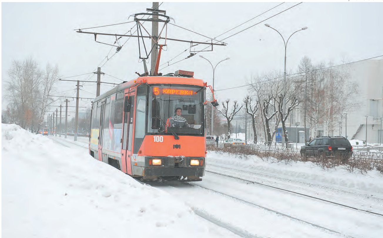
По итогам работы МУП «Пермгорэлектротранс» за первую половину 2016 года на 30% сократились простои трамваев и троллейбусов

Надёжности трамвайного сообщения в Перми способствует работа второго эксплуатационного депо «Красный Октябрь», открытие которого состоялось в 2015 году. Эффективность его деятельности говорит сама за себя: теперь предприятие ежегодно экономит около 1 млн руб. за счёт снижения рисков сбоев при выпуске трамваев на линии. Уже к концу прошлого года на 80% сократилось количество простоев по причине поломки подвижного состава. Возобновление выпуска трамвайных маршрутов №3, 4, 6, 7, 8, 13 из депо «Красный Октябрь» позволило снизить нулевые пробоги этих маршрутов на 30%, что незамедлительно послужило причиной снижения расходов, подвижной состав