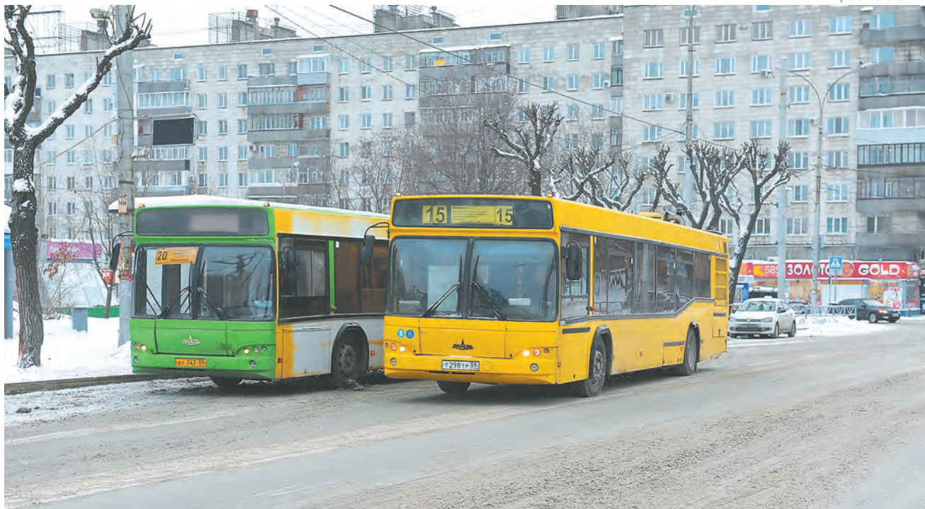
В нынешнем году исполнилось 90 лет автобусному сообщению в Перми. 9 мая 1926 года открылся первый городской маршрут