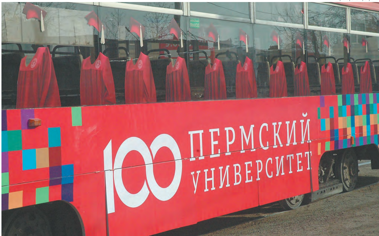
23 марта в первый рейс отправился фирменный «Вагон знаний», который появился в рамках празднования 100-летия Пермского университета