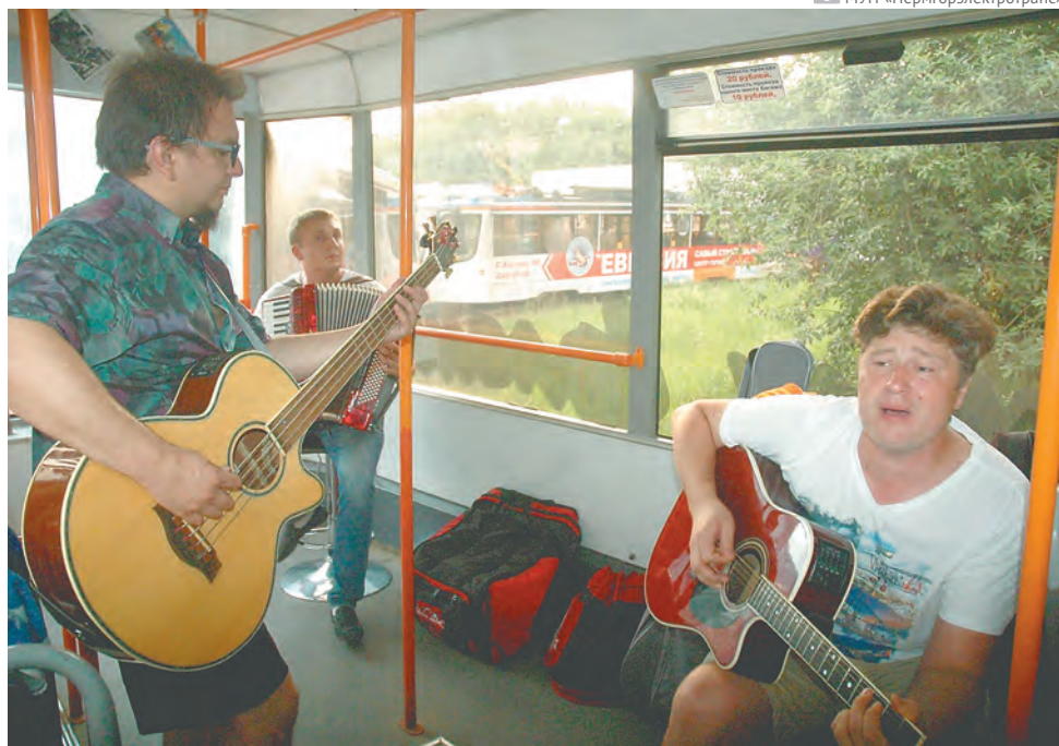
Пермский общественный транспорт служит не только средством передвижения: здесь можно послушать выступление рок-группы, посетить музей или отпраздновать свадьбу

— Электротранспорт практически всегда является планомерно-убыточным. Другое дело, что разумные города сумели его сохранить. Для него у нас в городе существует приоритет, и прежде всего это относится к трамваю, имеющему боль-