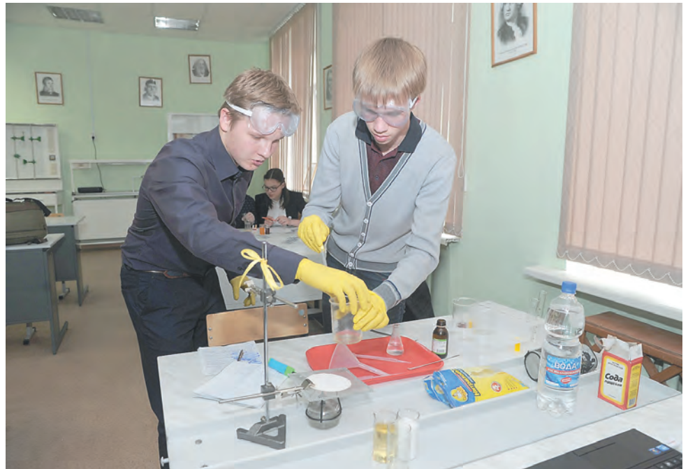
«Школа Сколково» призвана стать творческой лабораторией для одарённых детей

«Реализовывая проект «Школа Сколково», Пермский край становится одним