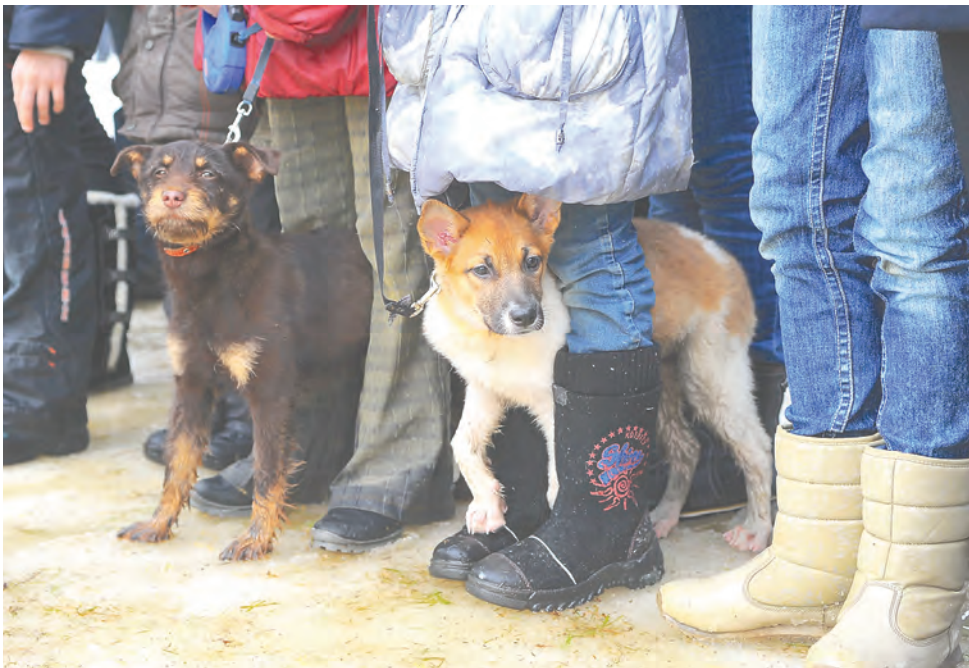
С начала года новых хозяев обрели уже 595 собак из муниципального приюта

— Состояние воздуха контролирует Государственная инспекция по