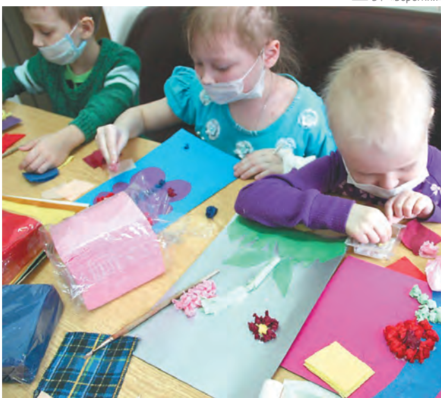
Малыши с онкозаболеваниями вынуждены носить маску постоянно, чтобы не подхватить вирус от окружающих людей

«Сегодня ни в одной стране мира нет 100%-ного вы-