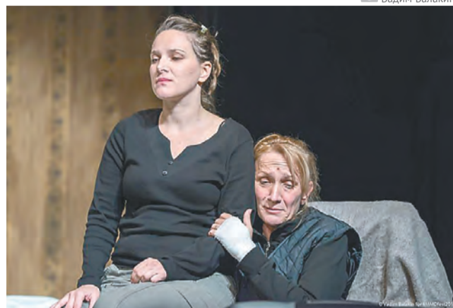
«Королева красоты», Черногорский национальный театр (Montenegrin National Theatre), Черногория

Это почувствовал коллектив Тамбовтеатра. Они по-