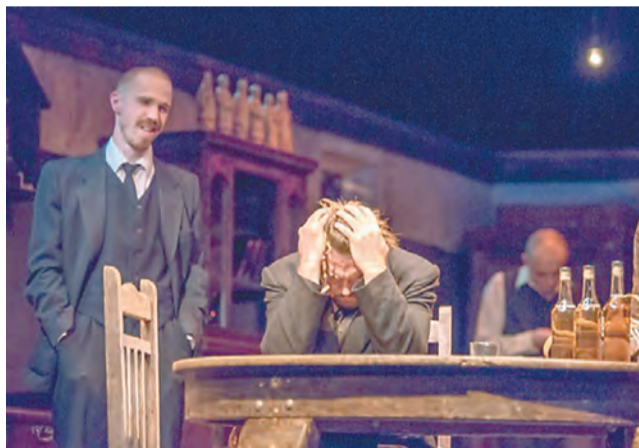
«Сиротливый Запад», театр «Старый дом», Новосибирск