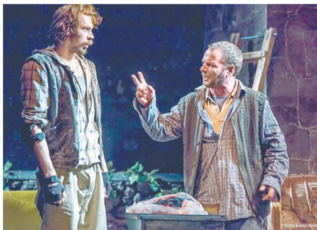
«Лейтенант с Инишмора», театр «У Моста», Пермь

и их обсуждениями на дискуссионных клубах с режиссёрами и членами жюри, лекциями и мастер-классами. Так, например, театровед и научный редактор российского издания книги «Театр и фильмы Мартина МакДонаха» Вера Шамина рассказывала об английской театральной жизни 90-х, а актёры азербайджанского ТЮЗа делились впечатлениями от постановки пьес знаменитого ирландца.