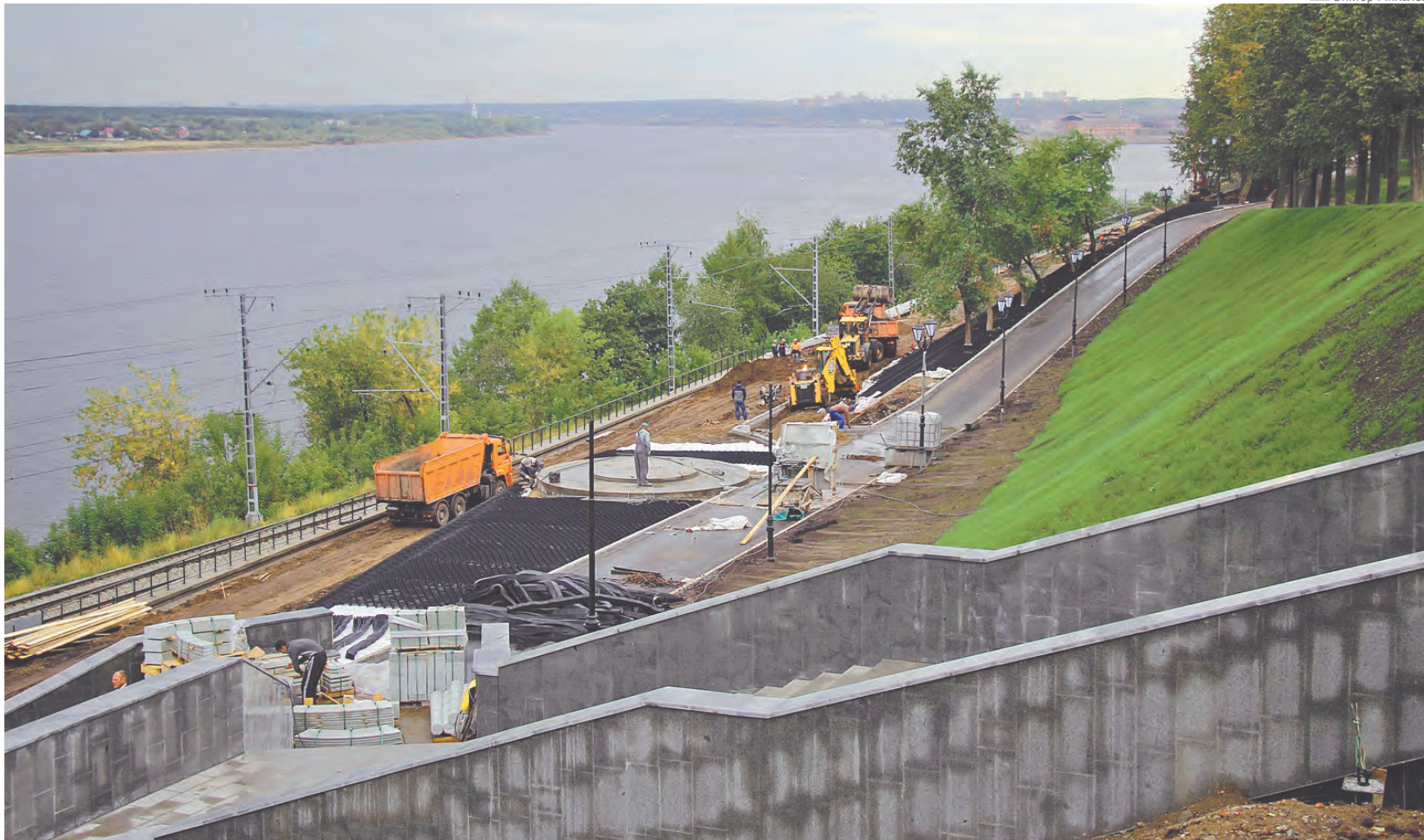
На набережной идут работы по обустройству ротонды