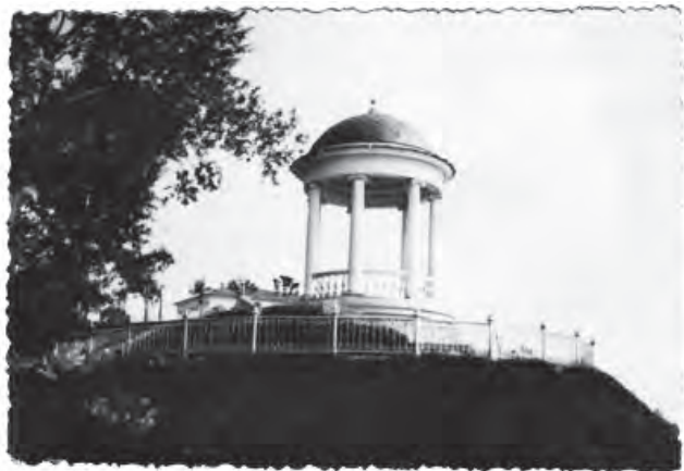
Ротонда на берегу Камы. Фото 1930-х годов

Приближается долгожданный момент завершения реконструкции второго участка набережной Камы. К этому событию администрация Перми подготовила для жителей города сюрприз — строители ведут к монтажу ротонды. Это будет аналог ротонды, которая была построена на берегу Камы в начале XIX века!