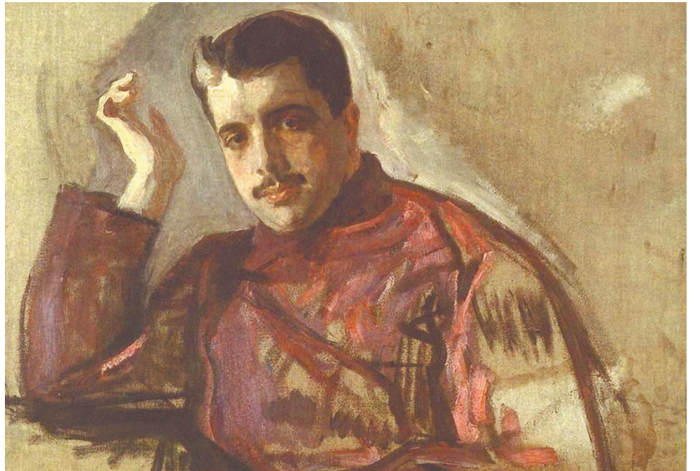
«Портрет Сергея Дягилева». Репродукция картины Валентина Серова (1904 г.)

В Перми Дягилевы поселились в своём родовом гнезде, доме на углу улиц Сибирской и Большой Ямской (ныне — улица Пушкина). Сейчас здесь располагается гимназия им. Сергея Дягилева. В этом доме, названном современниками «пермскими Афинами», по четвергам собиралась городская интеллигенция. Здесь музици-