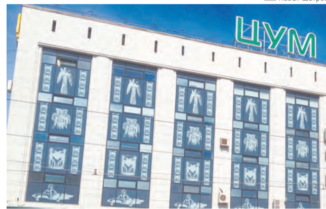
Образы Пермского звериного стиля украшают фасад ЦУМа

В произведениях пермского звериного стиля воплощены мысли и образы древних людей, то, как они познавали окружающий мир. Каждый их сюжет несёт глубокий смысл, порой полный тайн и загадок, неразгаданных и по сей день. Многие носят реалистичный характер, поэтому достаточно легко узнать, что пытался до нас донести древний мастер. Другие произведения носят поистине фантастический характер и изображают невиданных ящеров с бивнями мамонта или хищными клыками, птиц с человеческими головами и людей с головами птиц или животных.