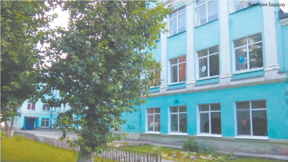
Принято решение о строительстве нового корпуса школы №42 на ул. Нестерова, 18