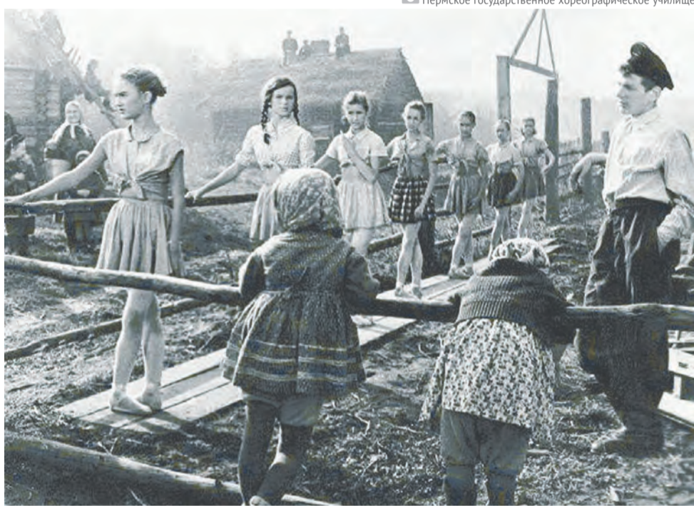
Ленинградское хореографическое училище в Перми, 1941 г.

По материалам статьи Л. И. Абызовой «Ленинградское хореографическое училище в годы Великой Отечественной войны»