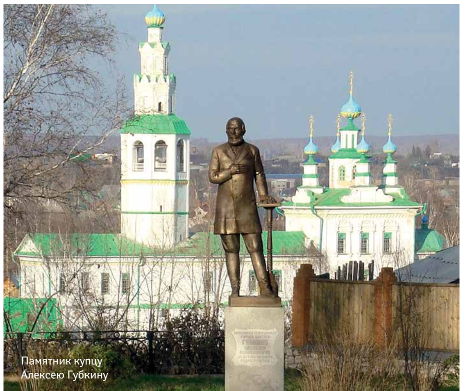
Памятник купцу Алексею Губкину