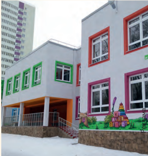
Новый детский сад в жилом комплексе «Альпийская горка»

Несмотря на развитие новых направлений деятельности, главный принцип работы «Камской долины» остаётся неизмен-