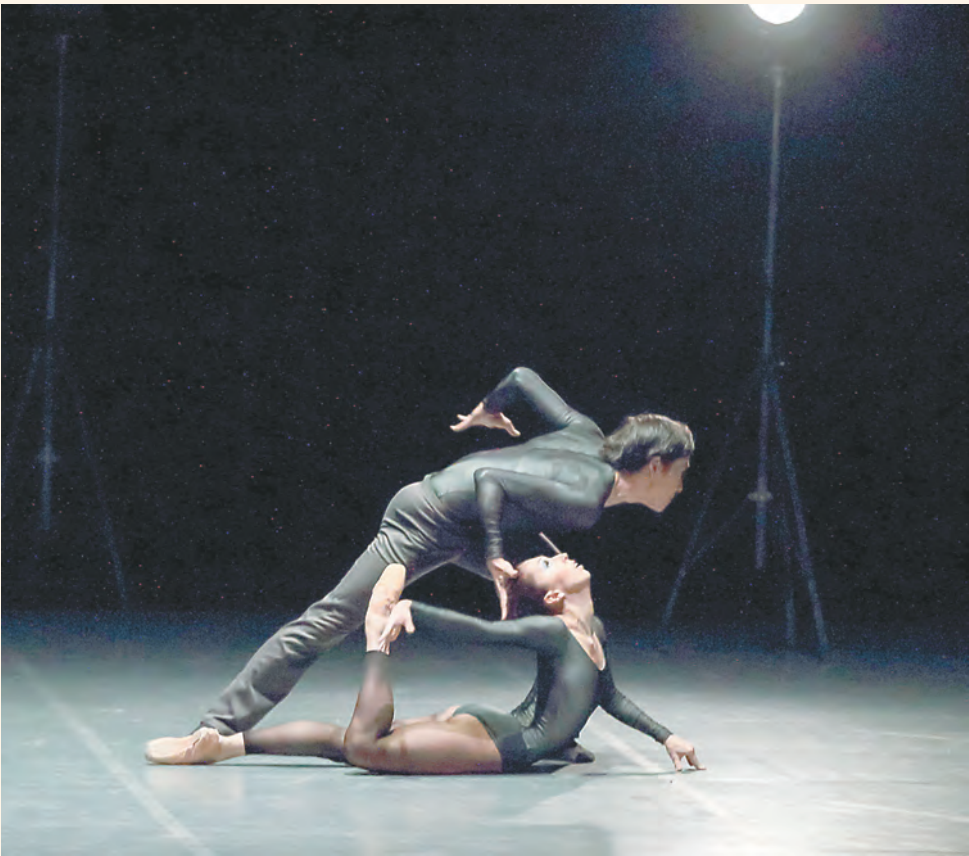
«Когда падал снег»