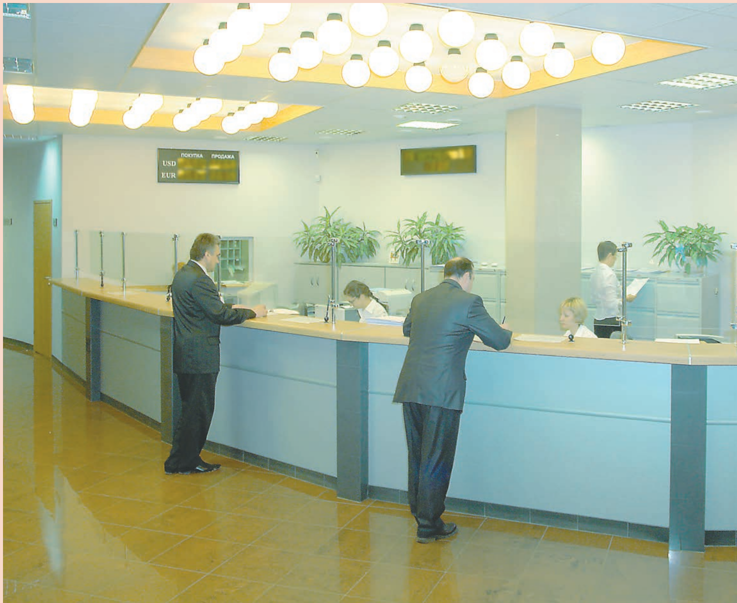
Доля региональных банков в общем объёме кредитования МСБ в Пермском крае