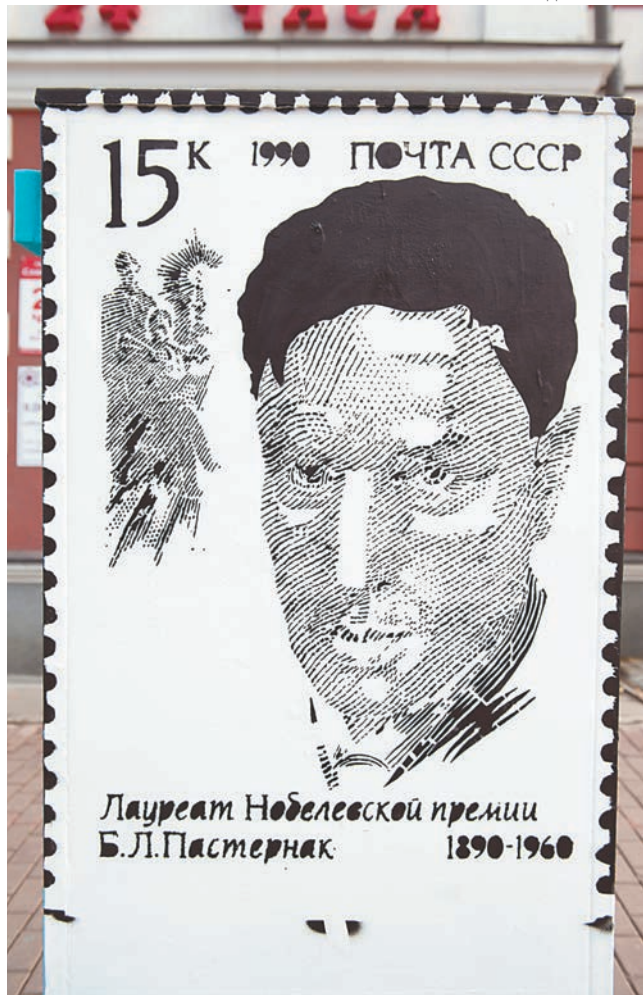
На перекрёсток улиц Ленина и Горького вернулся портрет Бориса Пастернака

нанести его же стихотворение, посвящённое Каме, и элемент лепнины с прославленного в романе «Доктор Живаго» дома с фигурами — особняка Грибушина. На объекте с Татищевым будут восстановлены схемы меде-