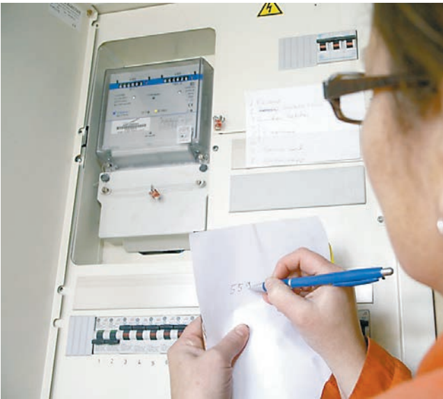
ДО применения повышающего коэффициента:

В связи с этим «Пермэнергосбыт» рекомендует гражданам установить прибор учёта электрической энергии. Отдельно стоит