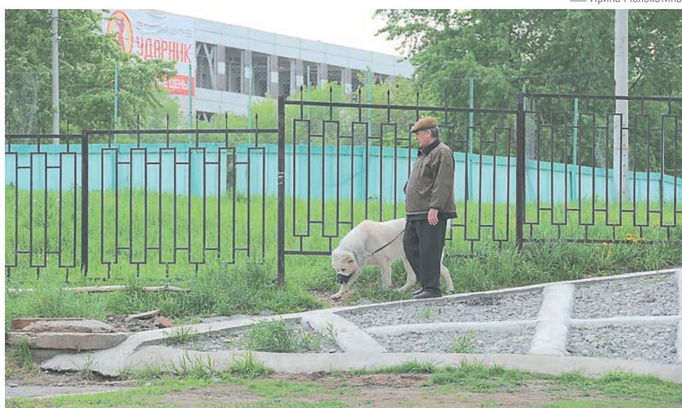
Чтобы собака не съела отравленную еду, лучше выгуливать её в наморднике