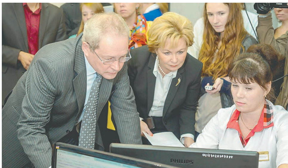
Виктор Басаргин оценил возможности электронной медкарты — все данные заносятся в единую базу, и врач любой поликлиники может видеть историю болезни пациента

Активно врачи поликлиники работают и над привлечением населения к прохождению диспансеризации. «Очень сложно преодолеть менталитет — люди привыкли приходить в больницу не на профилактику, а уже на лечение. Сложно сделать так, чтобы люди, которые считают себя здоровыми, пришли обследоваться. Мы предлагаем и эксклюзивные вещи —