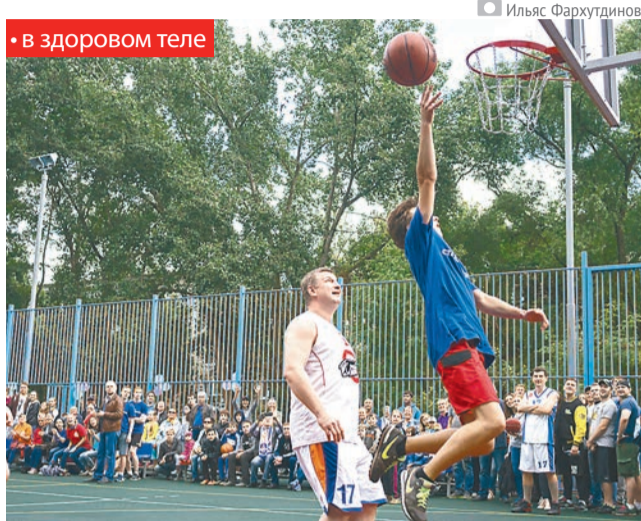
• В здоровом теле

«Эта площадка — подарок жителям Индустриального района от муниципального учреждения Городской спортивно-культурной комплекс. В рамках проекта «Детский спорт» мы развиваем дворовую активность на территории всей Перми, — рассказал региональный координатор проекта «Детский спорт» партии «Единая Россия», руководитель Городского спортивно-культурного