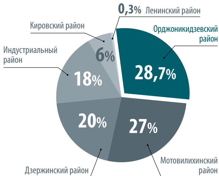
Таблица 2. Выданные разрешения на строительство

(данные департамента градостроительства и архитектуры администрации Перми (на 11 июня 2015 года))