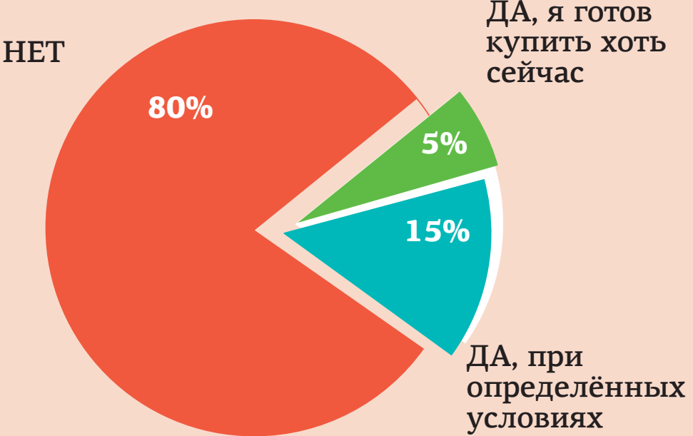
Готовы ли вы принять участие в забастовке против введения платности проезда через Чусовую?