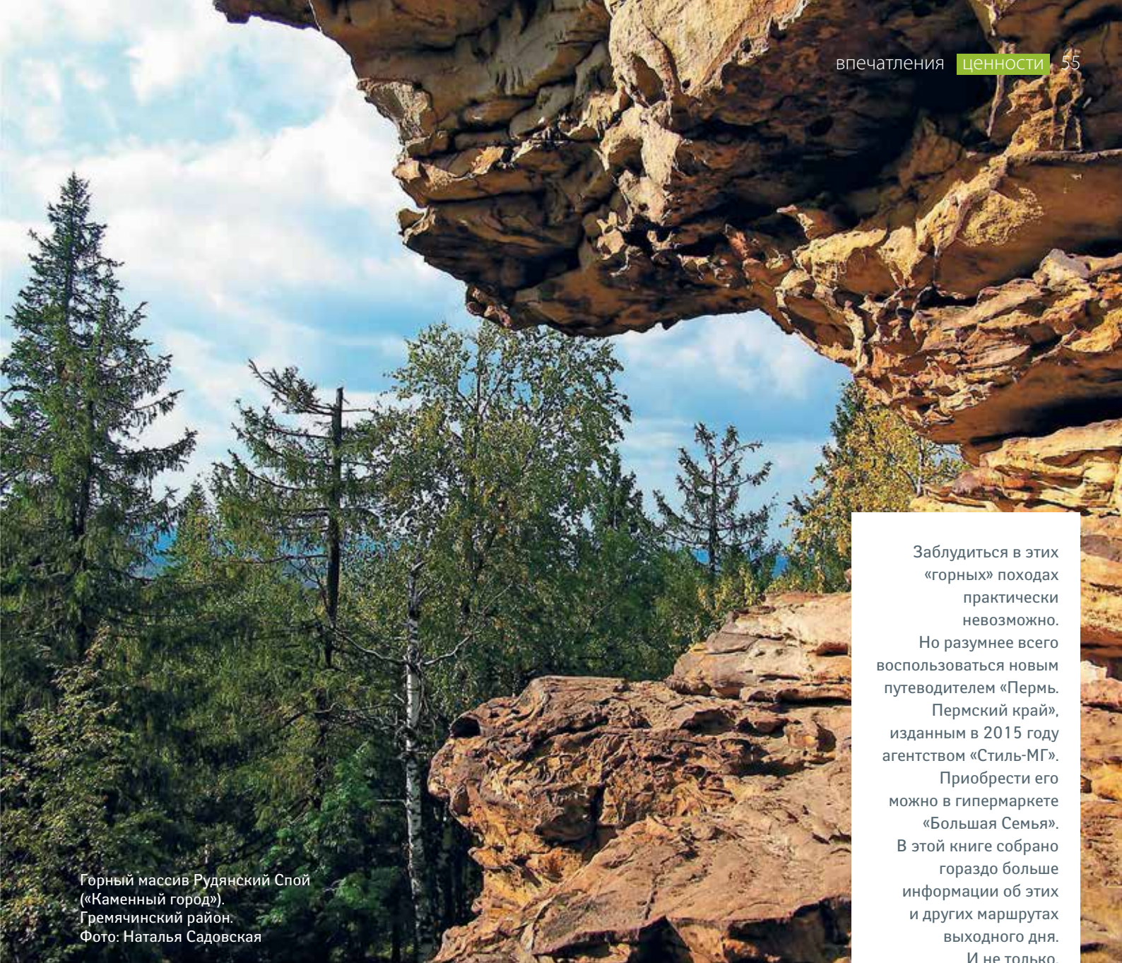
Горный массив Рудянский Спой («Каменный город»). Гремячинский район.

Заблудиться в этих «горных» походах практически невозможно. Но разумнее всего воспользоваться новым путеводителем «Пермь. Пермский край», изданным в 2015 году агентством «Стиль-МГ». Приобрести его можно в гипермаркете «Большая Семья». В этой книге собрано гораздо больше информации об этих и других маршрутах выходного дня. И не только.