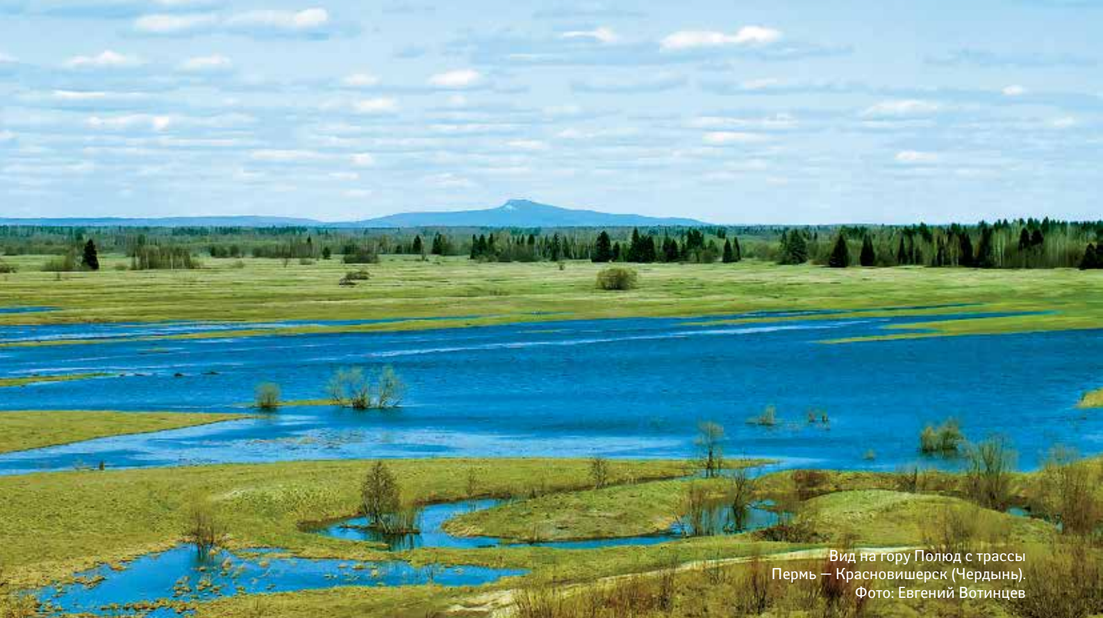
Вид на гору Полюд с трассы Пермь — Красновишерск (Чердынь).