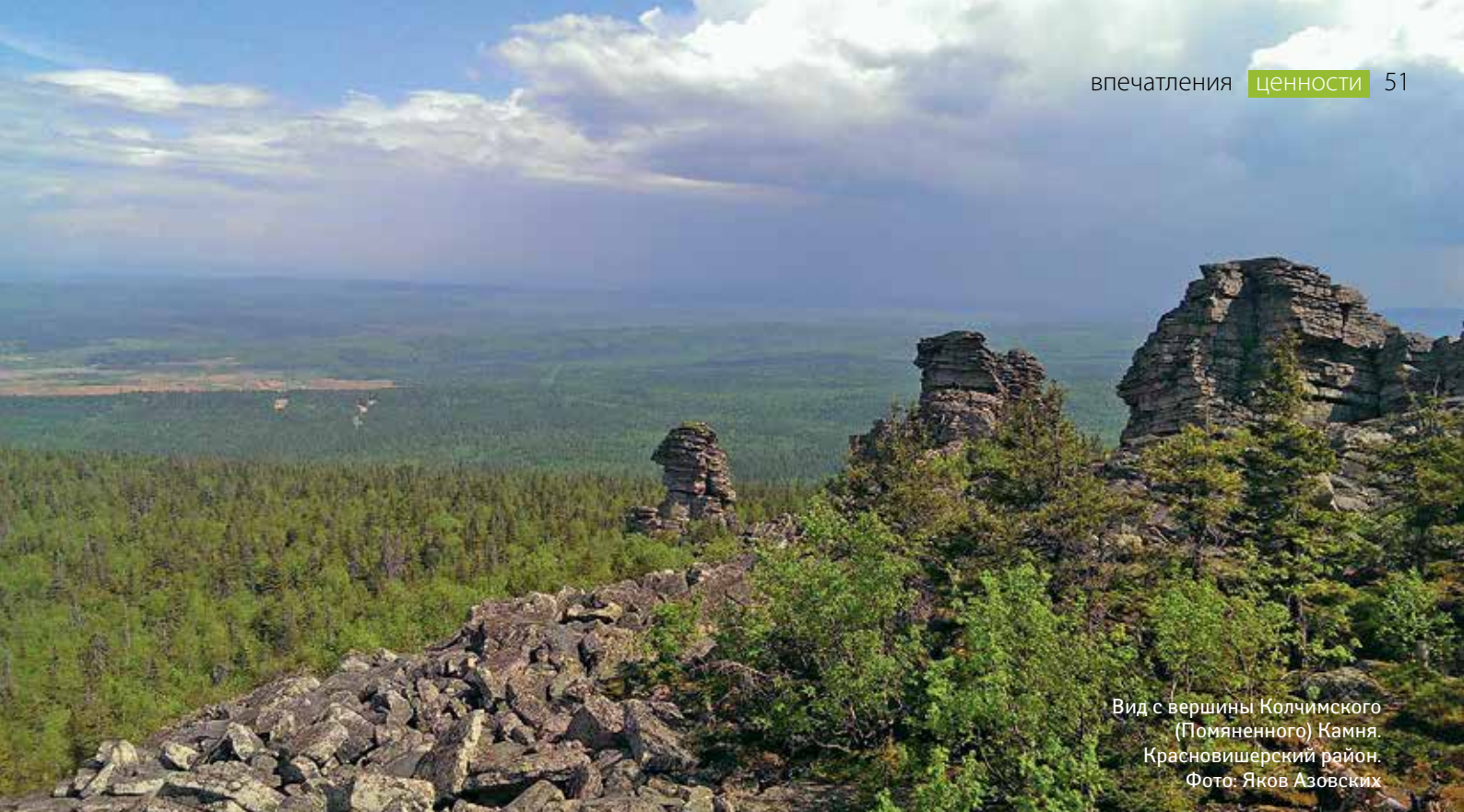
Вид с вершины Колчимского (Помяненного) Камня. Красновишерский район.