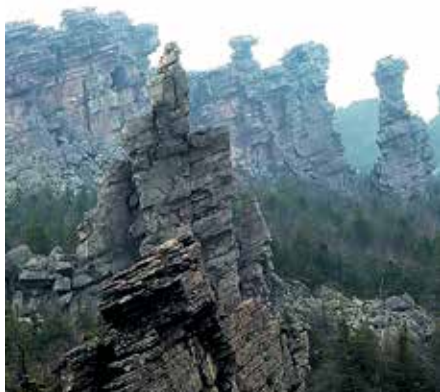
Останцы выветривания. Вершины Колчимского (Помяненного) Камня. Красновишерский район.

ХАРАКТЕРНЫЕ СТОЛБЫ ВЫВЕТРИВАНИЯ НА ВЕРШИНАХ ПОХОЖИ НА ГРЕБНИ ФАНТАСТИЧЕСКОГО ДРАКОНА, УСНУВШЕГО ГДЕ-ТО В ГЛУБИНЕ ЭТИХ ЗОЛОТО- И АЛМАЗОНОСНЫХ МЕСТ. ПОЧТИ ЛЕГЕНДАРНАЯ ГОРА ИЗ «ВЛАСТЕЛИНА КОЛЕЦ»