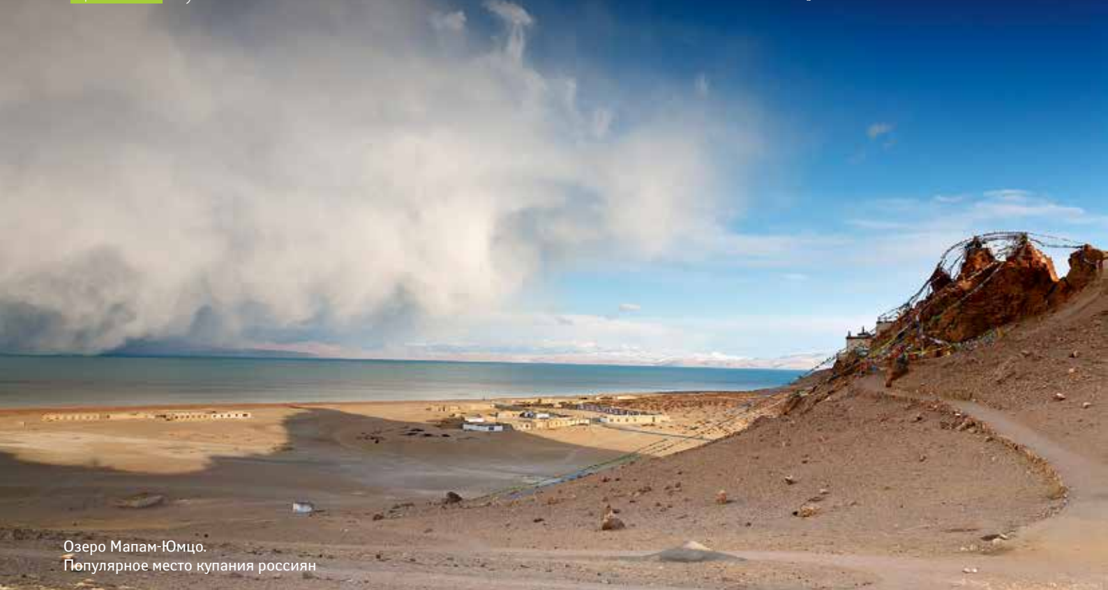
Озеро Мапам-Юмцо. Популярное место купания россиян

отели. Благодаря огромным денежным вливаниям восстанавливаются монастыри, полностью разрушенные во времена культурной революции, в саду монастыря Сэра слышны голоса монахов, практикующихся в искусстве диспутов, а в храмы монастыря Ганден устанавливаются новенькие изваяния Охранителей. Духовная культура Тибета преодолела его границы и стала привлекательной для населения стремительно развивающегося Китая. Буддизмом интересуются китайские бизнесмены, совершающие паломничества по святым местам, делающие щедрые пожертвования и подношения в восстановленных храмах. Считается, что тантрические ритуалы способствуют привлечению удачи, богатства и успешности. Духовный туризм россиян вполне вписывается в эту современную картину.