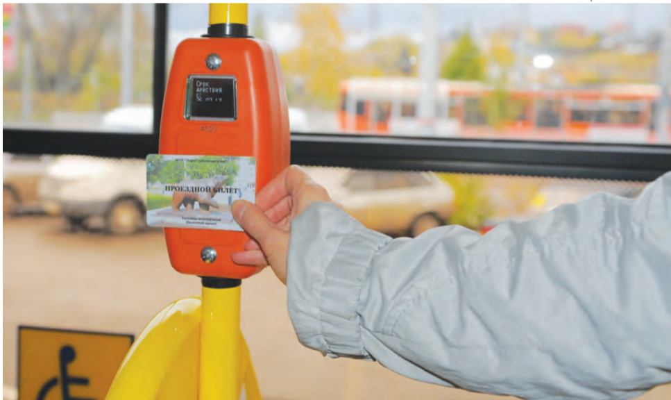
1 октября этого года в Перми должна быть введена электронная оплата проезда в общественном транспорте