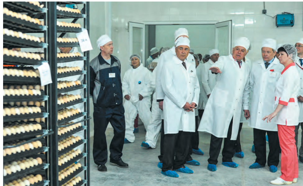
На экскурсии по производству птицефабрики гостям продемонстрировали процесс выведения цыплят

С ним согласился Виктор Басаргин, отметив, что потребности нашего региона в яйцах и картофе сейчас обеспечены на 100%. «Думаю, что в ближайшее время мы решим вопрос продовольственной безопасности и по мясу птицы», — резюмировал губернатор.