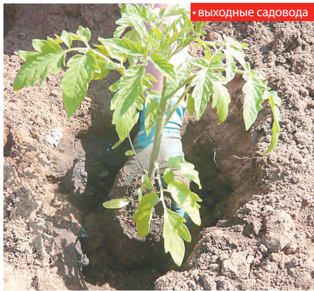
• ВЫХОДНЫЕ САДОВОДА

Очень хорошо отзывается томат на подкормки гуматами калия и натрия. Их можно чередовать с подкормками основными удобрениями. В пасмурную прохладную погоду, когда корневое питание затруднено, полезны внекорневые подкормки. Их желательно проводить мелкодисперсным опрыскивателем таким образом, чтобы мелкие капельки попадали на нижнюю сторону листа и не стекали.