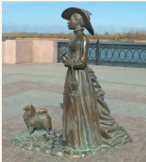
Дама с собачкой на астраханской набережной

Астраханская область может считаться по российским меркам благополучной и обеспеченной: здесь и промышленная добыча газа, и каспийская нефть, и великолепные условия для сельского хозяйства — все знают астраханские арбузы и астраханские томаты. С туризмом тоже всё было в порядке до недавнего времени: волжские теплоходные круизы частенько заканчивались в Астрахани.