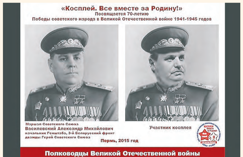
Скандал в Перми начался именно с этой картинки

Крупнейшие финансово-промышленные группы уже начинают верстать свои планы на предстоящий большой