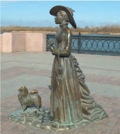
Дама с собачкой на астраханской набережной

Астраханская область может считаться по российским меркам благополучной и обеспеченной: здесь и промышленная добыча газа, и каспийская нефть, и великолепные условия для сельского хозяйства — все знают астраханские арбузы и астраханские томаты. С туризмом тоже всё было в порядке до недавнего времени: волжские теплоходные круизы частенько заканчивались в Астрахани.