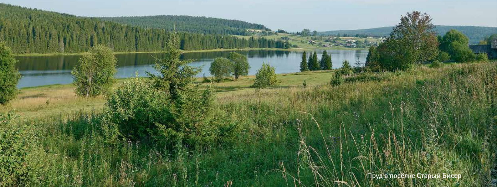
Пруд в посёлке Старый Бисер