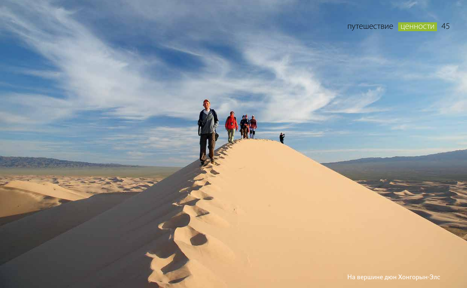
На вершине дюн Хонгорын-Элс

лий, потраченных на восхождение. При благоприятной погоде осыпающийся песок вызывает глубокую вибрацию, сопровождающуюся низким гулом на грани инфразвука, настоящую песню дюн.