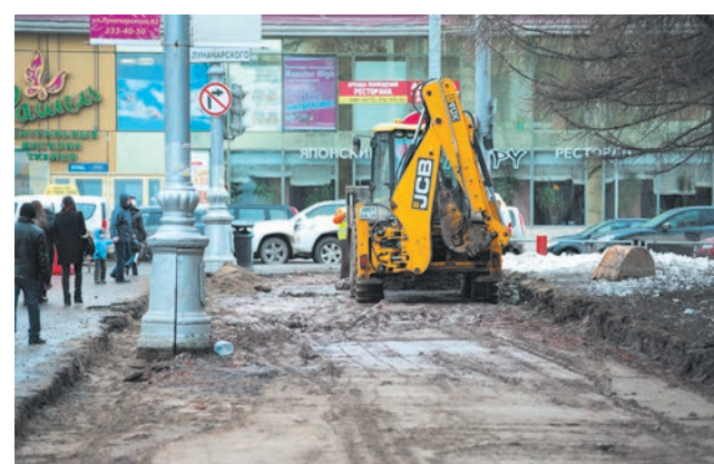
Ремонт тротуаров на Октябрьской площади