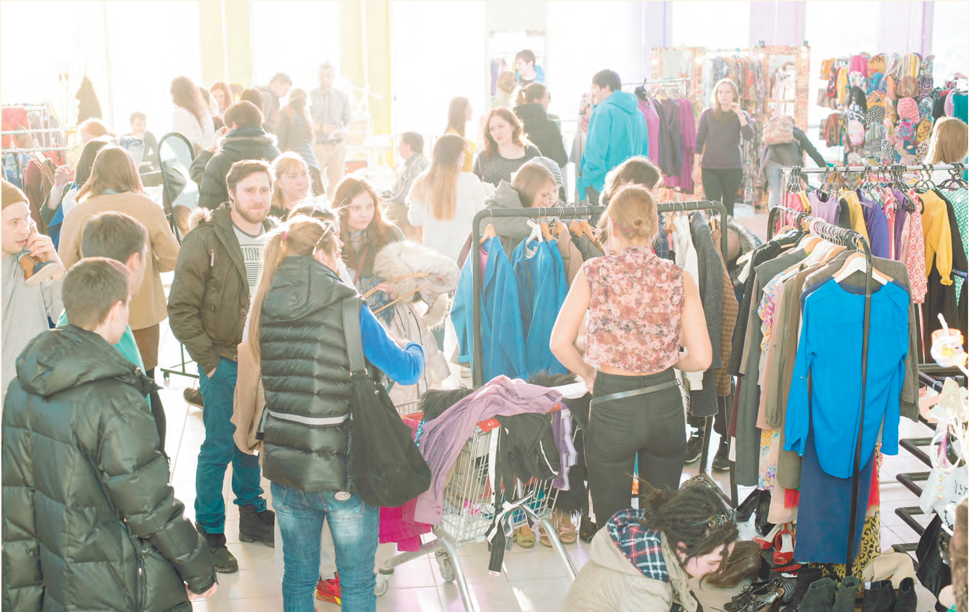
Снижение физического объема продаж в ритейле будет продолжаться, конкуренция между торговыми сетями и производителями сохранится на высоком уровне